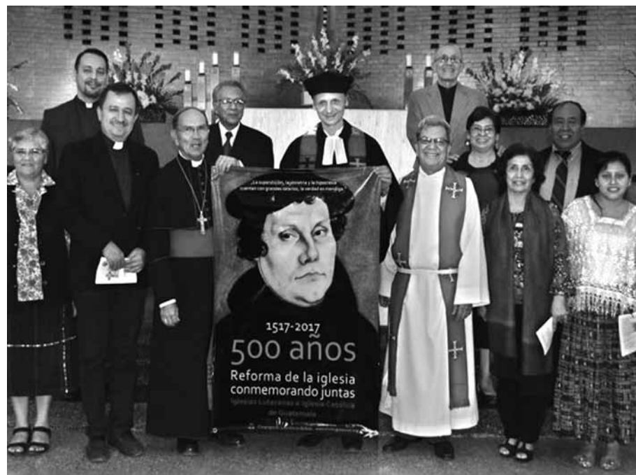
Conmemorando juntas las Iglesias Luteranas y la Iglesia Católica - como el 31 de octubre de 2016

No puedo obrar de otra manera. Ampáreme Dios. Amén.“