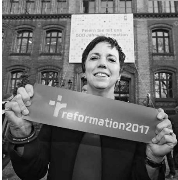
Dra. Margot Kaessmann en Wittenberg

En octubre del 2016 el presidente del Partido social-demócrata, Sigmar Gabriel, la propuso públicamente, como posible candidata como presidenta de Alemania. Kaessmann rechazó este ofrecimiento en una breve exposición pública.